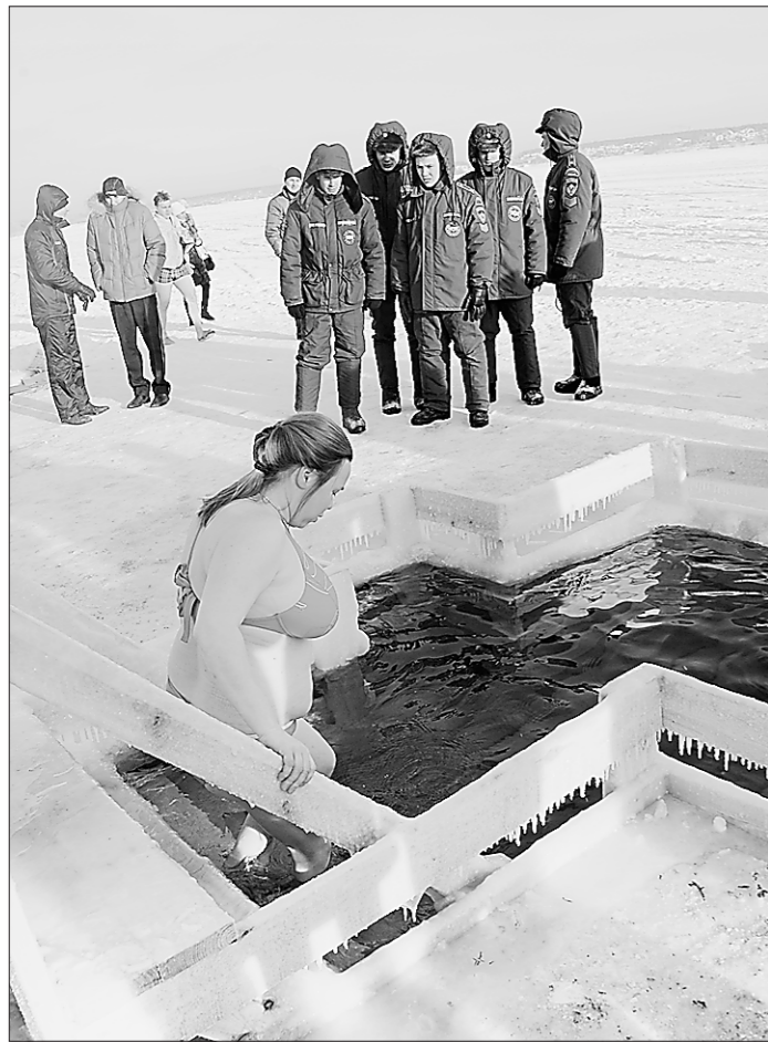
Спасатели пристально, очень пристально следили за купающимися

Современные технологии в последнее время всё больше используются для поддержки инвалидов. Нельзя не сказать