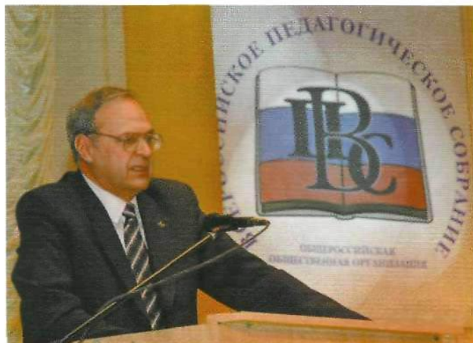
Ректор УрГПУ Б.М. Игошев, заслуженный работник высшей школы РФ, почетный работник высшего профессионального образования Российской Федерации, почетный работник общего образования

Общий педагогический стаж семьи составляет более 100 лет!