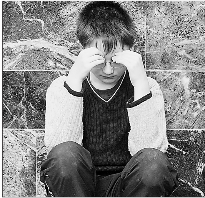
Ребёнок не всегда может помочь себе сам. В сложной ситуации кто должен оказывать ему поддержку?

В начале зимы и Россия отменила массовыми митингами против результатов выборов в Государственную Думу. Знали бы американские коллеги, что и в Екатеринбурге тоже были акции протеста, может, в облик женщины на обложке добавили бы что-нибудь уральское.