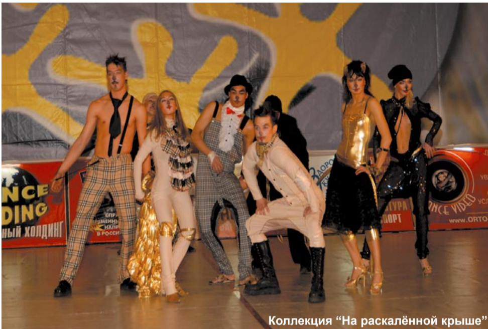
Коллекция «На раскалённой крыше»

тила нас не очень тёплой, но ясной погодой. Первое, что поразило меня, — это метро. Глубже, чем в Екатеринбурге, раз в 5! И не 7 станций, а на порядок (!) больше. Следующим открытием для меня стали московские дороги. Странно, но они... ровные! Ездить по