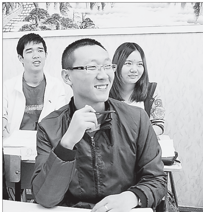
Для них русский язык, как для нас китайская грамота

По личной просьбе героини публикации автор не называет настоящих имён персонажей и даже названия города. Эти данные имеются в редакции газеты.