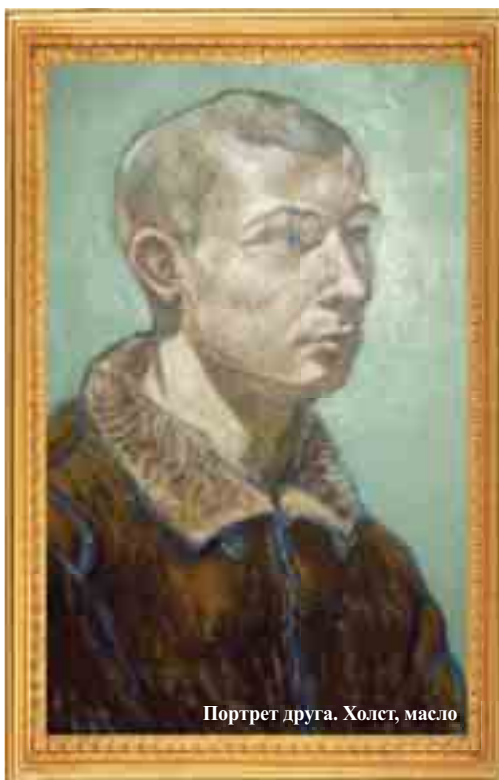
Портрет друга. Холст, масло