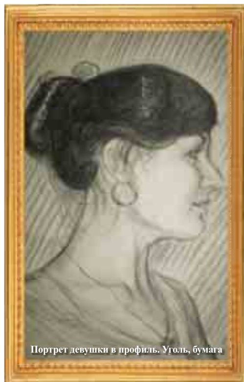
Портрет девушки в профиль. Уголь, бумага