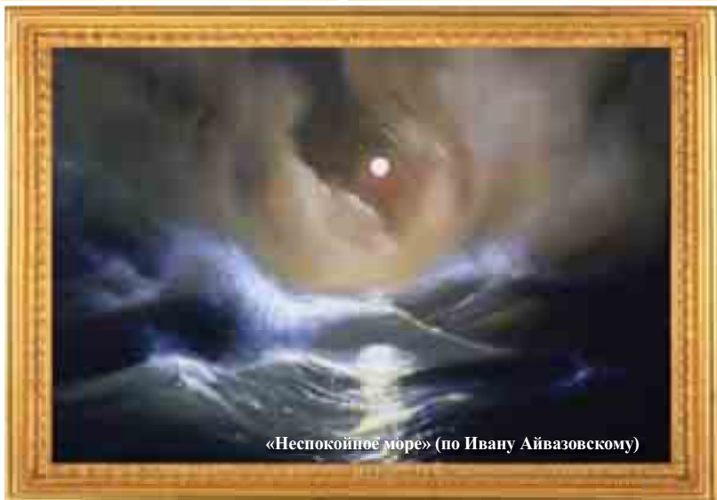
«Неспокойное море» (по Ивану Айвазовскому)