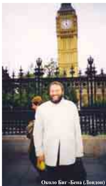
Около Биг - Бена (Лондон)