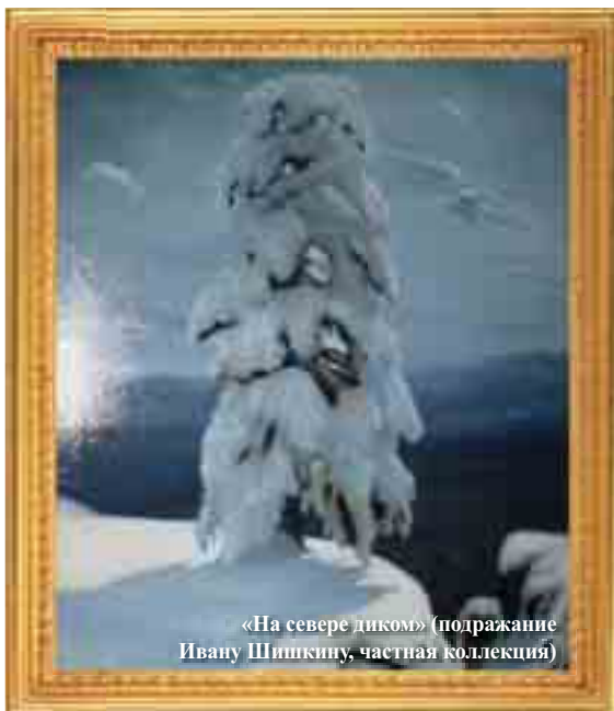
«На севере диком» (подражание Ивану Шишкину, частная коллекция)