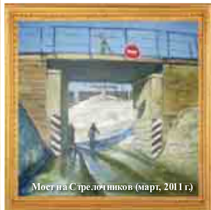
Мост на Стрелочников (март, 2011 г.)