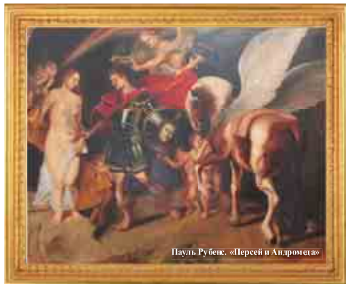
Пауль Рубенс. «Персей и Андромеда»

- В будущем мне бы хотелось работать в крупном, мирового класса, музее в качестве экскурсовода или в отделе реставрации. Хотелось бы занять определенную нишу в мире искусства – либо в плане экспертной оценки, либо реставрационного дела.