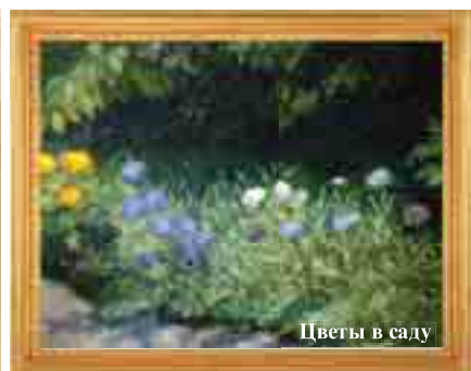
Цветы в саду