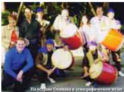
На острове Окинава в этнографическом музее

400 научных работ, в том числе 20 монографий, член редакционных коллегий Уральской исторической энциклопедии (1998, 2002 гг.), энциклопедии «Екатеринбург» (2002 г.), журнала «Уральский исторический вестник». Активно занимается историческим краеведением.