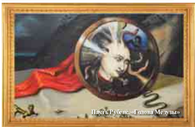
Пауль Рубенс. «Голова Медузы»