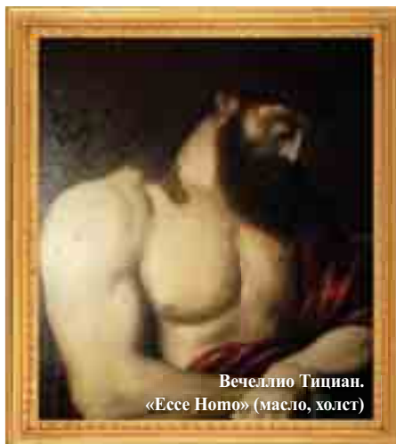
Вечелино Тициан. «Ессе Ното» (масло, холст)