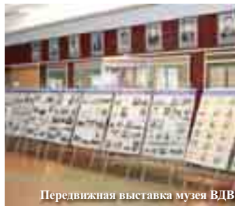
Передвижная выставка музея ВДВ