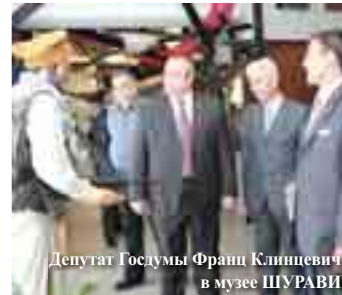
Депутат Госдумы Франц Клинецевич в музее ШУРАВИ