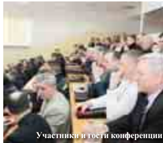
Участники и гости конференции