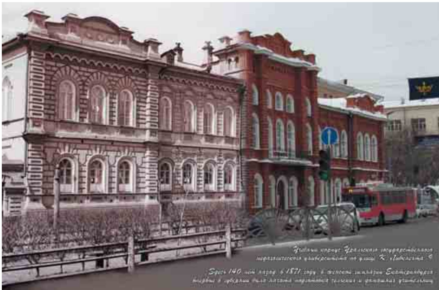
Уральский городок Челябинский государственный педагогический университет на улице К. Маркса, 9. Срок 140 лет, марта, в 1871 году, в здании здания Екатеринбургской женской гимназии была открыта первая педагогическая школа и открылся учебный корпус.

Газета работников и обучающихся Уральского государственного педагогического университета