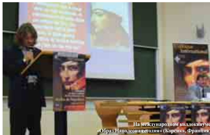
На международном коллоквиуме «Образ Наполеона сегодня» (Корсика, Франция)

(но не само общество и властные структуры) заинтересован в раскрытии подлинных проблем войны 1812 года. Поэтому, как мне думается, важнейшим вопросом при изучении темы Отечественной войны 1812 года является отношение к этому событию (в том числе и как к факту национальной исторической памяти) различных категорий современного российского общества и его элиты.