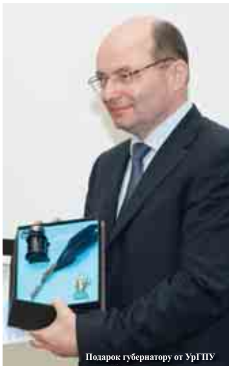
Подарок губернатору от УрГПУ

На встрече со студентами 25 января губернатор Свердловской области Александр Мишарин выразил готовность рассмотреть ряд предложений Ассоциации профсоюзных организаций студентов вузов, в числе которых: участие правительства Свердловской области в конкурсе на лучшее студенческое общежитие, учреждение премии «Студент года», создание студенческого информационного холдинга, Центра поддержки и развития студенческих отрядов проводников России, предоставление аспирантам, интернам и ординаторам права приобретения студенческой Е-КАРТЫ – единого проездного билета.