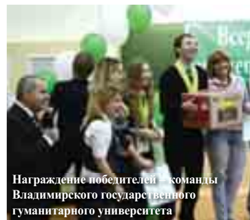
Награждение победителей – команды Владимирского государственного гуманитарного университета

Гостей и участников ВСО поздравили творческие коллективы города. Сборная команда ВСО подготовила свое ответное слово принимающей стороне – институту психологии УрГПУ. В зале не смолкали аплодисменты, а в завершение зал стоя подпевал группе «Неформаль», исполнившей песню «Поворот». Участники обменивались поздравлениями, координатами и очень надеялись на следующую встречу – здесь же, в институте психологии, на восьмой Всероссийской студенческой олимпиаде по специальности «Педагогика и психология»!