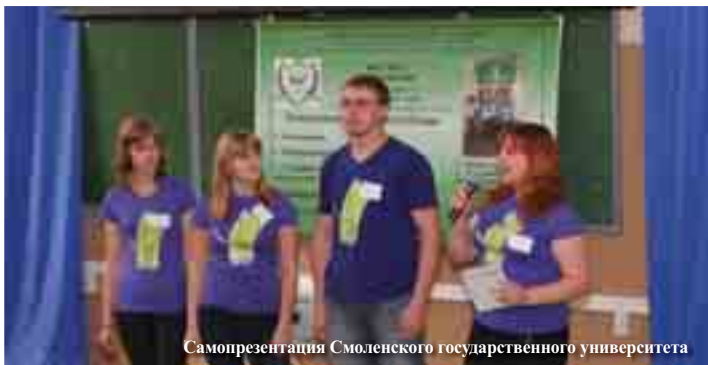
Самопрезентация Смоленского государственного университета

С 19 по 21 октября 2010 года в институте психологии УрГПУ проходила VII Всероссийская студенческая олимпиада по специальности «Педагогика и психология». Студенты-психологи ведущих вузов страны решали проблемы, обобщенные темой «Педагог-психолог и общество: взаимодействие и ответственность».