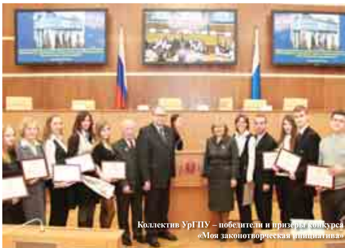
Коллектив УрГПУ – победители и призеры конкурса «Моя законотворческая инициатива»