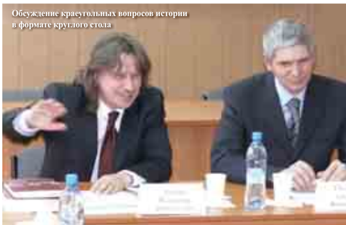
Обсуждение краеугольных вопросов истории в формате круглого стола

– Какие аспекты данной темы, на Ваш взгляд, являются наиболее проблемными или менее изученными?