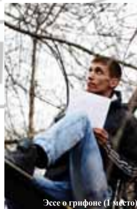
Эссе о грифоне (1 место)