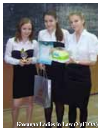
Команда Ladies in Law (УрГЮА)

Кафедра иностранных языков благодарит всех участников и желает им дальнейших успехов в изучении иностранных языков!