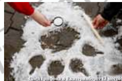
След грифона в Екатеринбурге (3 место)