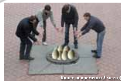
Капсула времени (3 место)