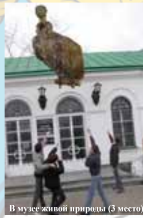
В музее живой природы (3 место)

По результатам фотоквеста, конкурса детских рисунков и конкурса на лучшее дизайнерское решение в главном корпусе УрГПУ была организована выставка лучших работ участников.